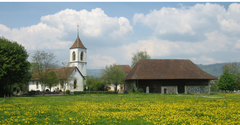
Die Aegerter Kirche im Ortsteil Bürglen.

Wanderung aus dem Brückenort Aarberg durch die beinahe unendliche Ebene des Mooses an den Fuss des Jäissbergs und diesem entlang zum Brückenort Brügg. Auf der gradlinig verlaufenden Römerstrass mag zuweilen etwas wie «Legionärs-Koller» aufkommen. Interessant ist dagegen ein Besuch der römischen Ruinen von Petinesca und der kirchlichen Baugruppe von Aegerten/Bürglen. Leider lange Asphalt-Strecken.