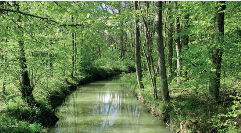
Der Lyssbach nahe der Einmündung in die Alte Aare.

Wo einst die Aare als mächtiger und unberechenbarer Fluss durchzog, erstreckt sich heute ein stiller Wasserlauf, der von idyllischen Auenwäldern umgeben ist. Durch dieses einzigartige Naturschutzgebiet führt ein abwechslungsreicher Wanderweg. Ein besonderes Juwel gleich am Anfang der Route ist das Landstädtchen Aarberg mit seinen historischen Bauten. Zu Beginn und am Schluss der Wanderung etwas Hartbelag, sonst durchwegs Naturwege.